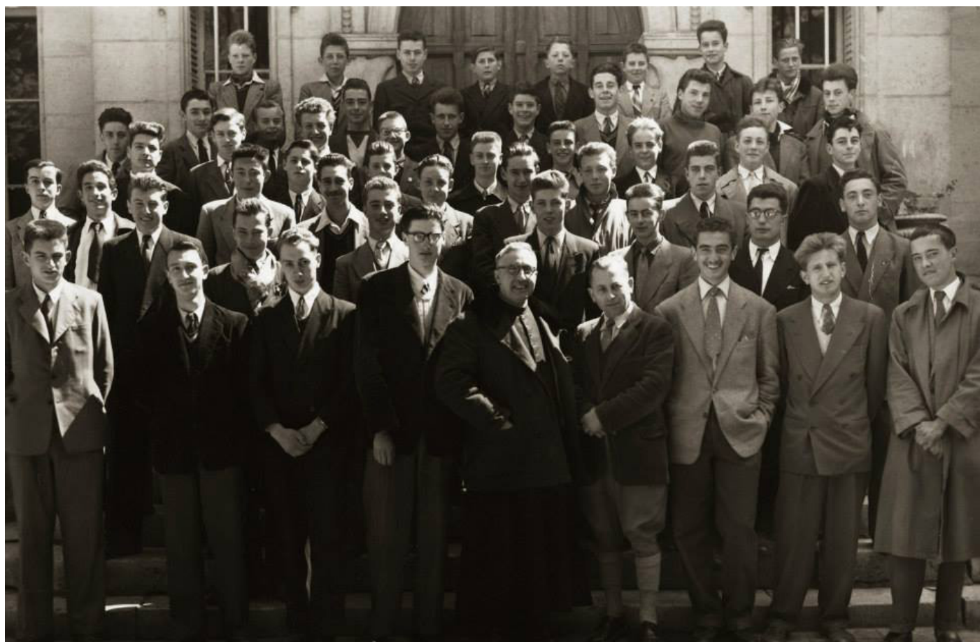
L'abbé Charles Quentin et les élèves de l'École Supérieure d'agriculture du Prieuré sur le perron du château.

Plein de projets, il crée une salle de cinéma alors qu'il est curé près de Vouziers. Il écrit même des scénaris de films qu'il souhaite diffuser dans cette salle.